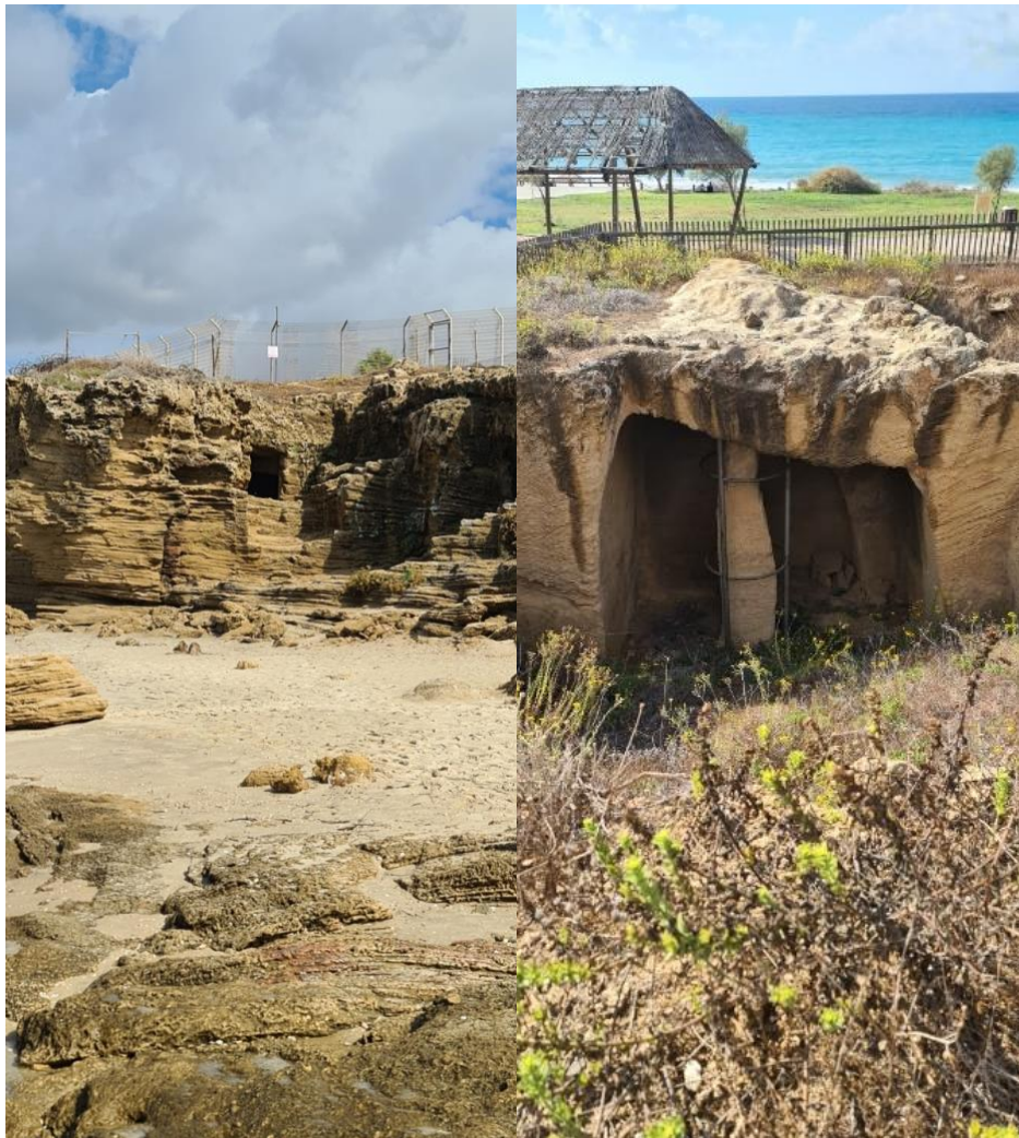
Man har funnet graver ved Palmahim tidligere. Bildet til venstre er i nærheten av kibbutzen og bildet til høyre er fra nasjonalparken