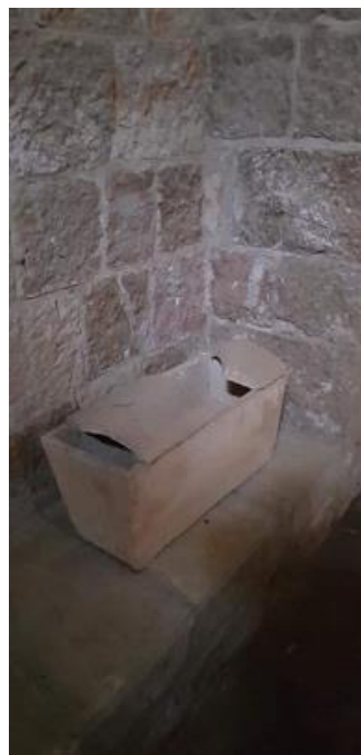
Dette bildet er av en «beinkiste», laget i keramikk

Etter hvert skiller man mellom gammel og ny testamentlig begravelse. I det gamle testamente står ofte setningen; «forent med sitt folk» eller «samlet til sine forfedre». Ut fra det man har funnet av gamle graver, så ser det ut til at folk i gammel-testamentlig tid som regel ble begravet i fellesgraver sammen med andre familiemedlemmer. Disse gravene er ofte hugget ut i fjell og har egne avlukker med «senger» som er hule under. Dette er oppsamlingsrom for beinrestene av avdøde personer.