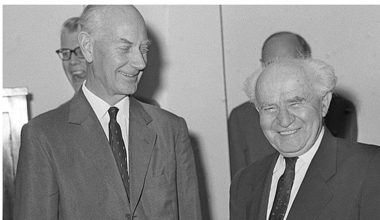
Arbeiderpartiet «Israels redningsmann»